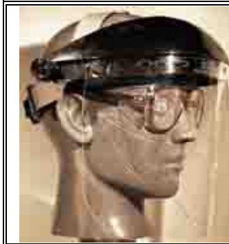
Caretas transparentes con protección superior (pueden estar montadas en un casco)